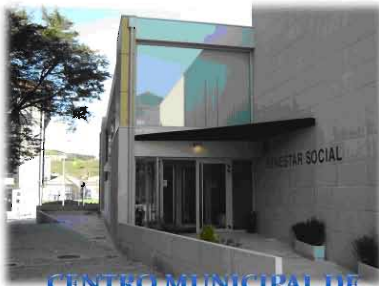
CENTRO MUNICIPAL DE SERVICIOS SOCIAIS – “SERVIZO DE PRIMEIRA ATENCIÓN”