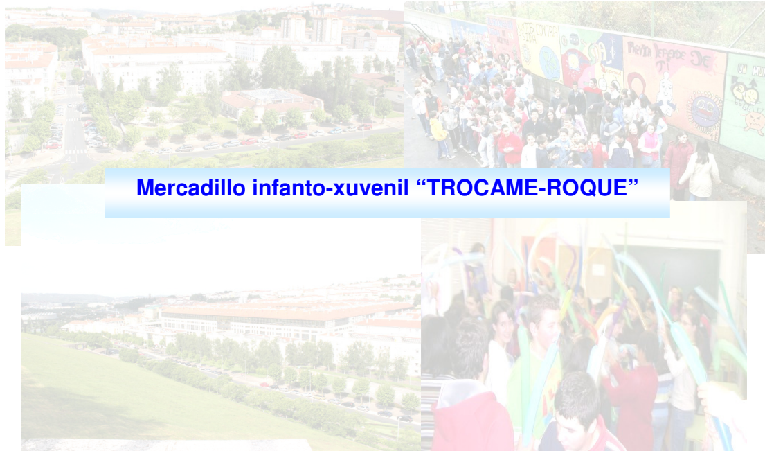
Mercadillo infanto-xuvenil “TROCAME-ROQUE”