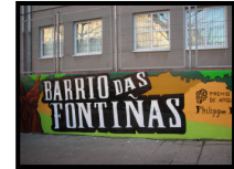
Gráfica nº 4: A intervención comunitaria no barrio de Fontiñas