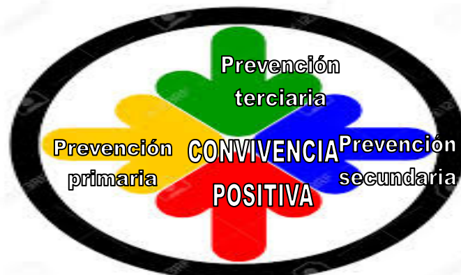
Gráfica nº 5: Fins da intervención comunitaria

Non hai que esquecer que os fins da intervención comunitaria non deben ser exclusivamente asistencialistas (si ben hai que traballar para a cobertura das necesidades básicas da cidadanía), senón que debe dar un paso adiante, incidindo na prevención, como veremos máis adiante, e na integración no contorno comunitario (non dende a asimilación senón dende a pertenza a un barrio, dende a convivencia positiva da súa veciñanza, respectando as diferenzas de cada quen).